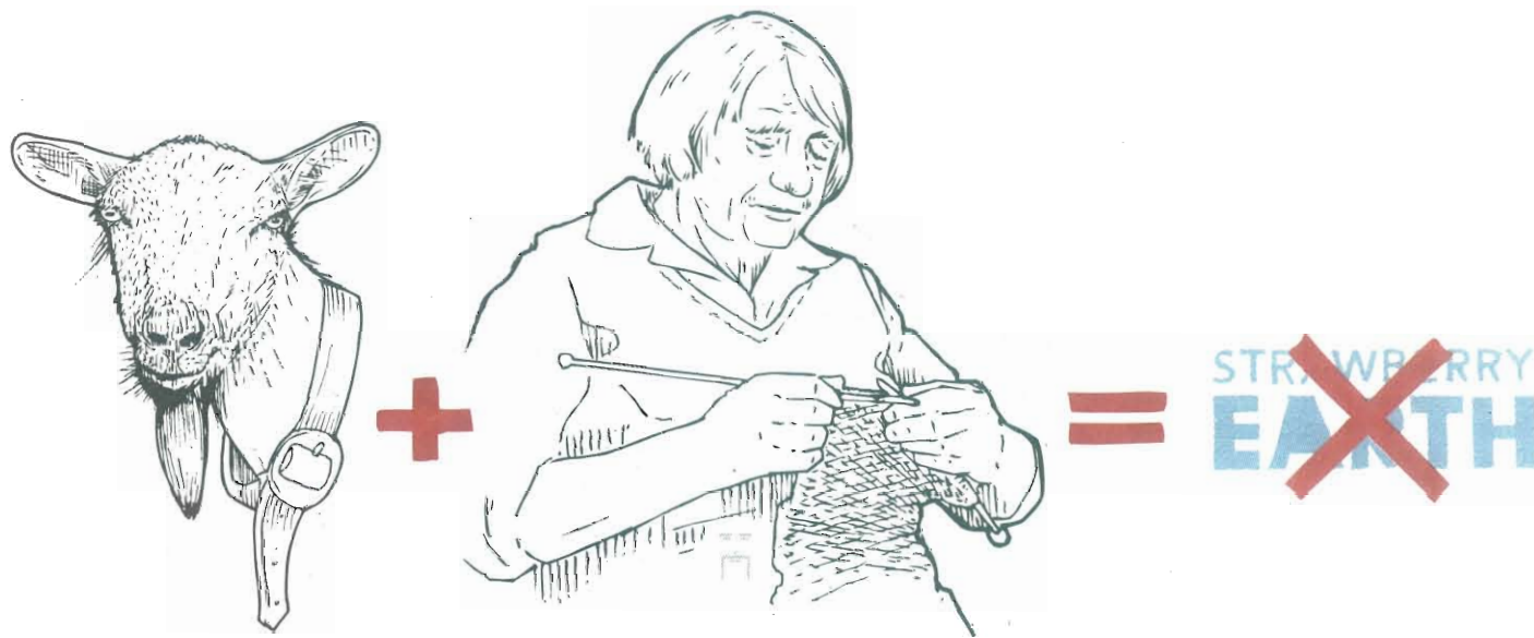
Illustratie Han Hoogerbrugge